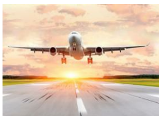
Vol international 📍