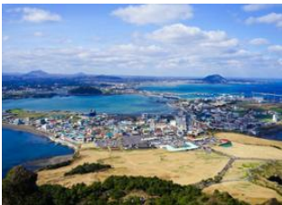
Ile de Jeju 📍 Village folklorique de Seongeup 📍 Ile de Jeju 📍