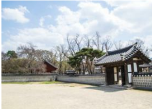
Haeinsa 📍 Jeonju 📍