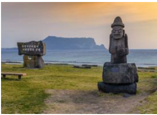
Ile de Jeju 📍