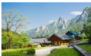
Séoul 📍 Seoraksan 📍