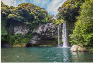
Busan 📍 ✈️ 302km - 🕒 55m Ile de Jeju 📍