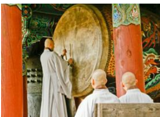
Ile de Jeju 📍 Haeinsa 📍