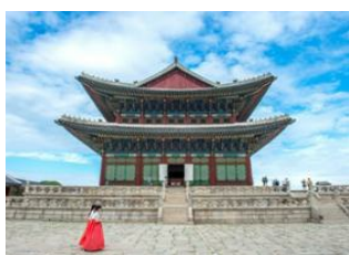
Seoraksan 📍 Séoul 📍