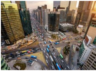
Jeonju 📍 Séoul 📍