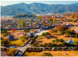
Boseong 📍 🚗 150km - ⌚ 1h 30m Jeonju 📍