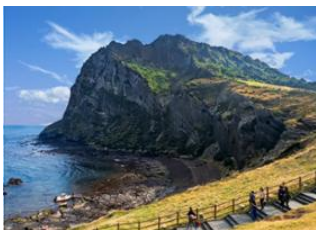
Ile de Jeju