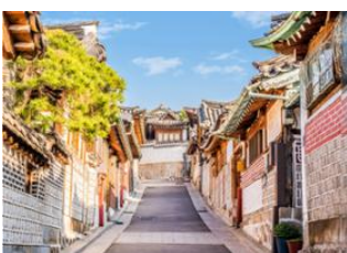
Jeonju 📍 🚗 210km - ⌚ 3h