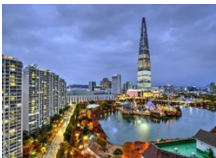
Ile de Jeju 📍 ✈️ 450km - ⌚ 1h Séoul 📍