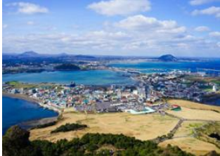
Ile de Jeju 📍 Village folklorique de Seongeup 📍 Ile de Jeju 📍