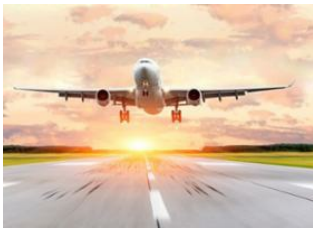
Vol international 📍