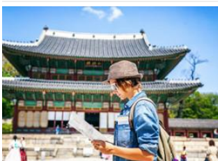
Aéroport Incheon 📍 50km - ⌚ 1h Séoul 📍