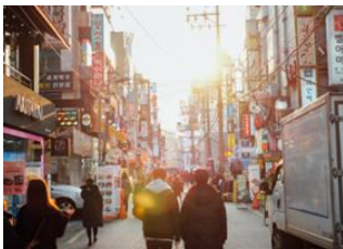
Busan 📍 🚗 450km - ⌚ 2h 45m Séoul 📍